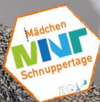
Ort: zdi-Schülerlabor cooMINT-passteiborn

Melde dich jetzt an unter: http://schnuppertage.fhws.de