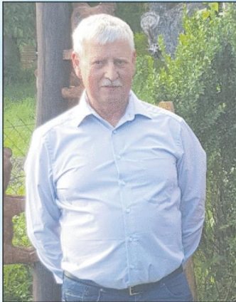
Hendungen, im Januar 2024

Wenn wir Dir auch die Ruhe gönnen, so ist voll Trauer unser Herz, Dich leiden sehen und nicht helfen können, war für uns der größte Schmerz.