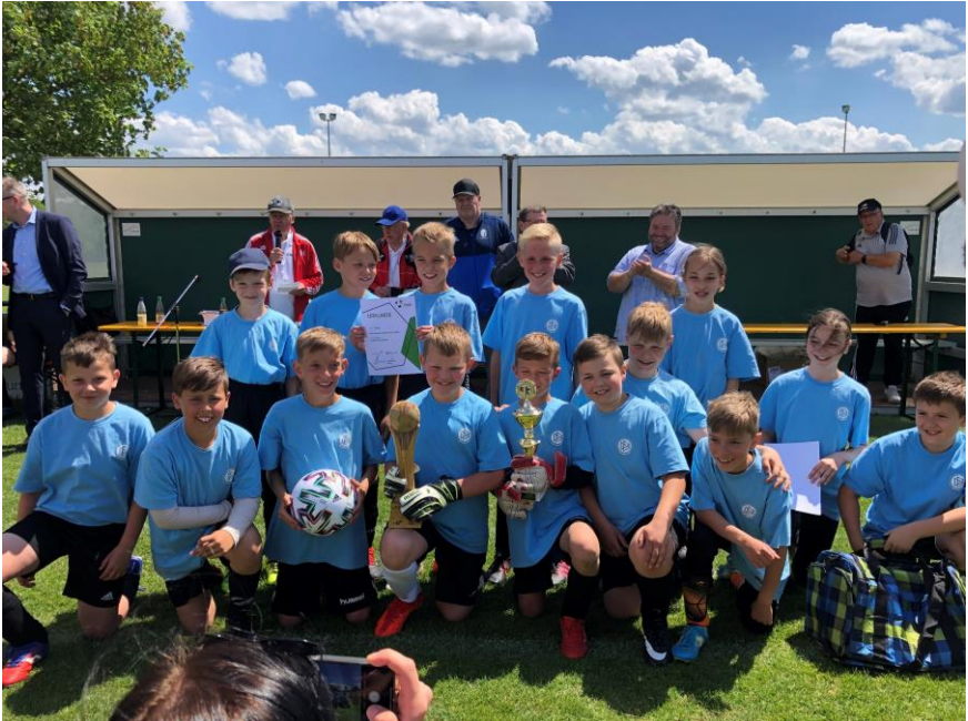
Bildunterschrift: So sehen Sieger aus! Die Mannschaften der Grundschulen Herpf und Sulzfeld freuen sich über ihren Sieg in ihrer Gruppe (Foto: Manuela Michel/ Landkreis Rhön-Grabfeld).