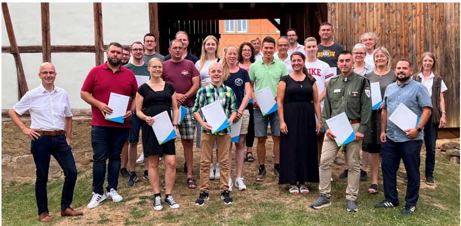
Bild: Happy End: 18 Anträge haben sich in diesem Jahr erfolgreich um die Kleinprojektförderung des Landkreises Rhön-Grabfeld beworben. Die Projektverantwortlichen können sich jetzt über eine finanzielle Unterstützung von je bis zu 1.000 Euro freuen (Foto: Ansgar Büttner).

https://www.rhoen-grabfeld.de/verwaltung/foerderungen/Kleinprojektefoerderung .